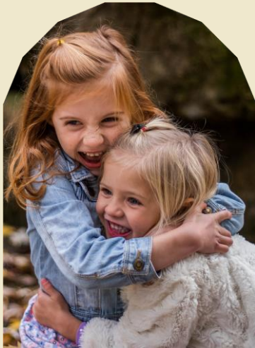
Die Drie Engele se Oproep tot Gebed